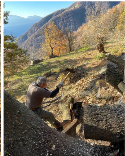
Diverse Einblicke zu den Events 2025....