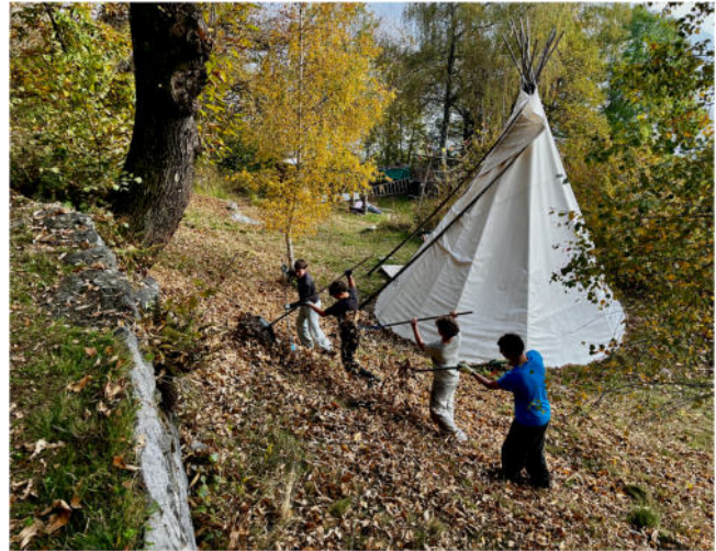
Arbeitseinsätze mit Schulklassen auf der Weide und den Terrassen